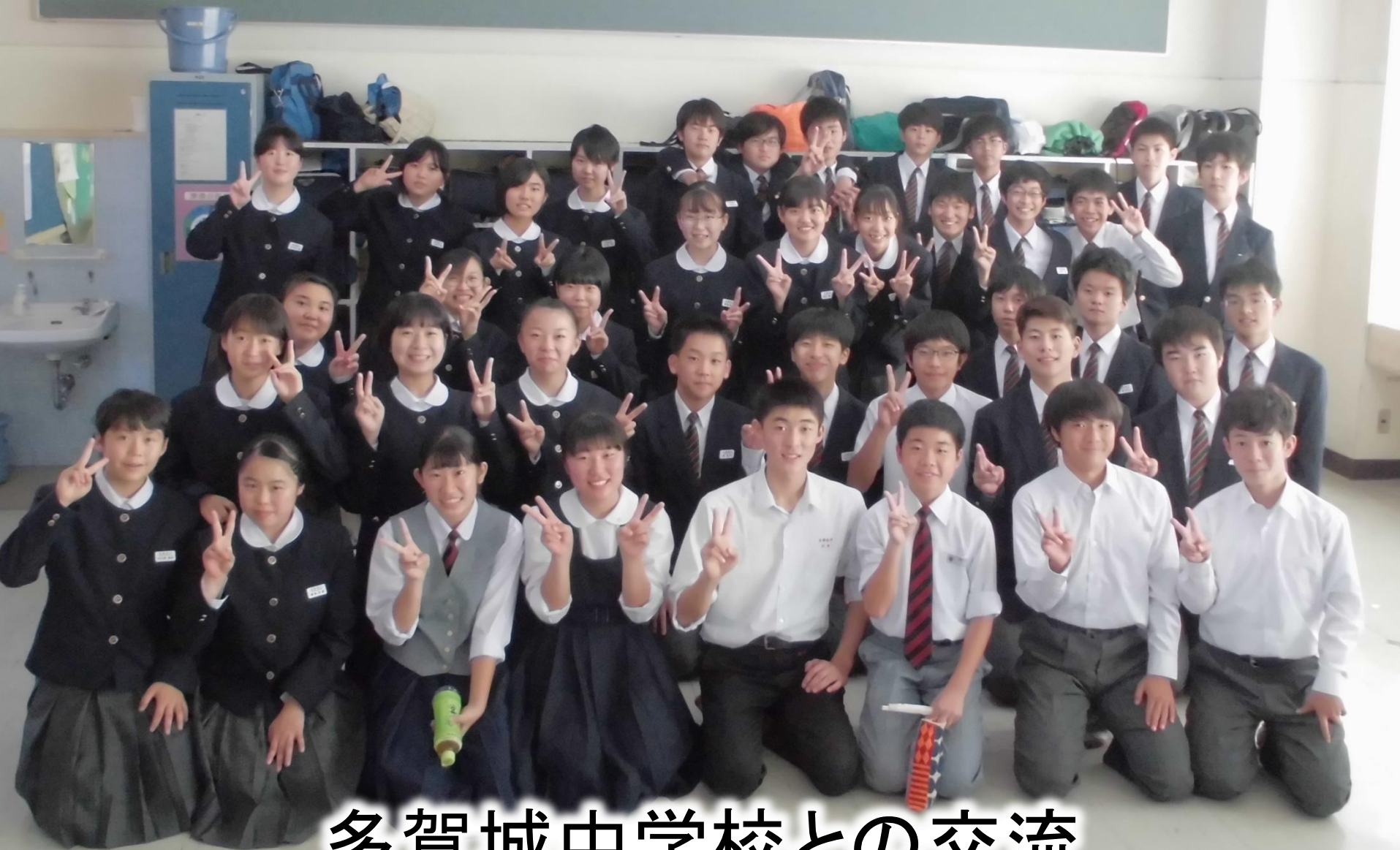
多賀城中学校との交流