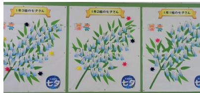
【1年生廊下にある七夕の掲示物】

内容を見てみると、やはり、コロナの影響でしょうか、家族の健康を願う内容も多く見られました。みなさんの願いが叶うといいですね。