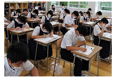
【集中してテストに向かう3年生】