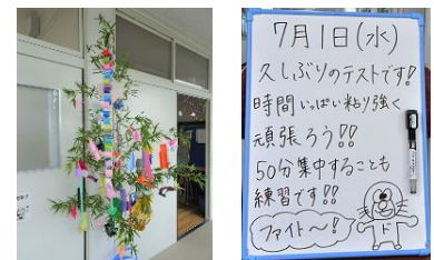
↑【左:あさかせ学級前の七夕】