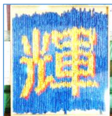
【全校生徒による共同制作】