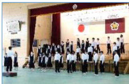
【2年最優秀賞 2の1「君とみた海」】