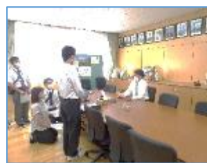
【オンライン開会式】