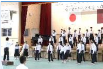
【1年最優秀賞 1の2「旅立ちの時」】

■当日は、どの学級も、これまで練習してきた成果を十分に発揮した、素晴らしい歌声を披露してくれました。1年生は、歌うことの楽しさを体全体で表現し、1年生とは思えないほどの表現力豊かな合唱を披露してくれました。2年生は、男声の深みのある声が加わり、一層厚みのあるハーモニーで繊細に表現してくれました。3年生は、どの学級もメッセージ性のある詩の内容を研究し、表現を工夫しながら圧巻の合唱を披露してくれました。審査をされた先生方からも、生徒のみなさんの素晴らしい合唱にたくさんのお褒めの言葉をいただきました。