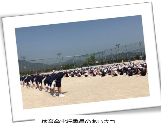
体育会実行委員のあいさつ