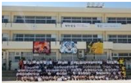
〈体育会後の3年写真撮影〉

自然教室は、1年生のみで行う初の行事です。海の中道青少年海の家で、2泊3日を過ごしてきました。天候の影響を受け、活動の変更もありましたが、野外炊飯やレクリエーション、DVD鑑賞、ロープワーク、海の家ビンゴ、海岸散策、キャンプファイヤー、クラスマッチ、マリンワールド見学をしました。3日間、共に過ごすことで、友達や先生方をより理解するようになり、絆が深まりました。また、人懐っこさや思いやり・優しさなども見ることができました。この経験をこれからの中学校生活にいかして、さらに成長することを期待します。