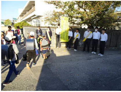
【にしの日：あいさつ運動】

具体的な生徒像（めざす生徒像） ・豊かな人権感覚をもち、自他の価値を認め、周りの仲間に気を遣うことができる生徒 ・人やもの、ことの良さを見つけ、尊重したり感動したりする心をもつ生徒 ・自ら課題を見つけ、課題解決に向け、意欲的に学習を進め、知識や技能を習得しようとする生徒 ・見通しをもって学習に励み、自分の学習を振り返るとともに、さらに学習を進めようとする生徒 ・心身ともに健康で、仲間と協力して学校生活を明るく前向きに過ごし、学校生活を充実させることができる生徒 ・将来、社会で活躍するための基礎や土台となる力や心を育もうとする生徒 ・地域行事等に積極的に参加・参画し、地域のために意欲的に活躍する生徒