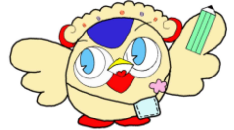
【マスコットキャラクター：うーちゃん】

学校の教育目標 「自ら輝き、成長を続け、なかまと共に心身逞しく、未来を創造する生徒の育成」 校訓 「自律・協調・実践」