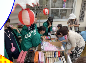
【夏まつり：運営参加】