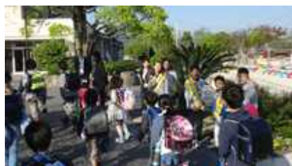
写真1 門の内側の挨拶運動（4月）