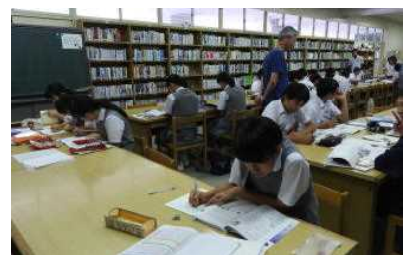
写真8 スタディタイム