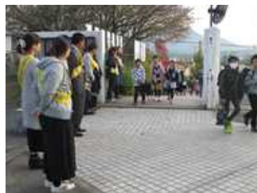
写真2 保護者・地域の方々（10月）