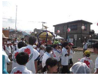
写真6 夏祭りボランティア