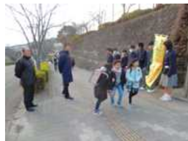
写真3 西中の生徒と教師（1月）