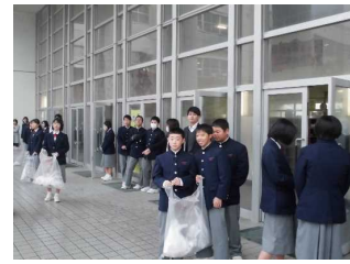
写真7 ピックアップ登校