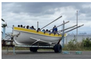
カッター陸上訓練