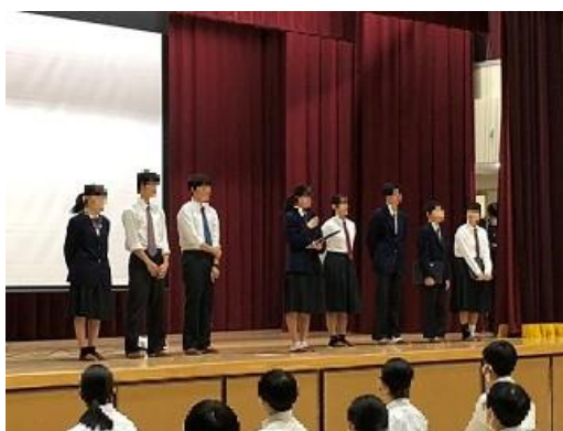
ふるさと大使の8名が、発表を頑張ってくれました