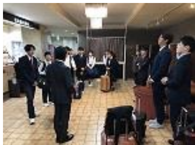
ホテル発。中学校へ向かいます