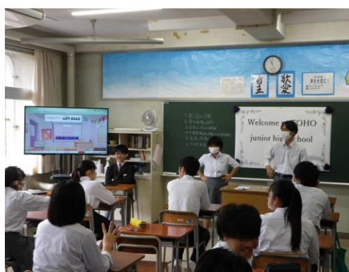
3年生の教室でも交流しました