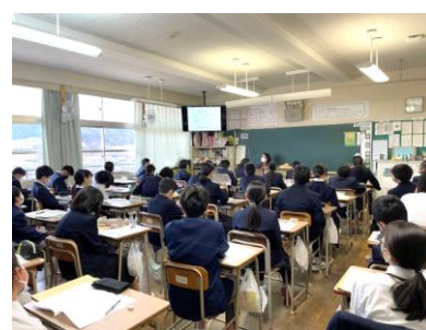
高校について学習しています