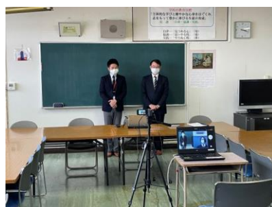
お二人の先生方です