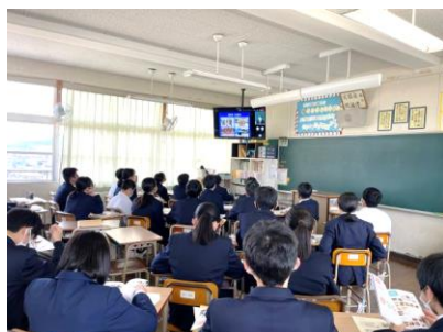
講話を視聴しています