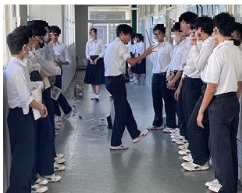
指揮者ノリノリ! 九響でも指揮をして自信が つきました