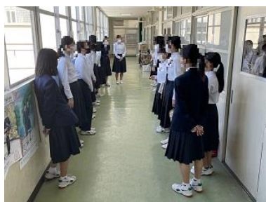
3年女子の歌声は とても素晴らしい!