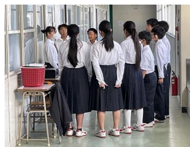
パート練習に 打込んでいます