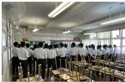
クラスのハーモニーが どんどん良くなっています!