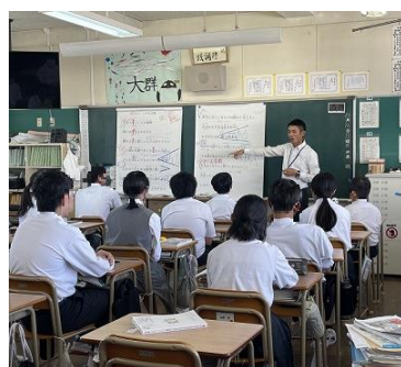
担任が歌詞について 熱く語りました