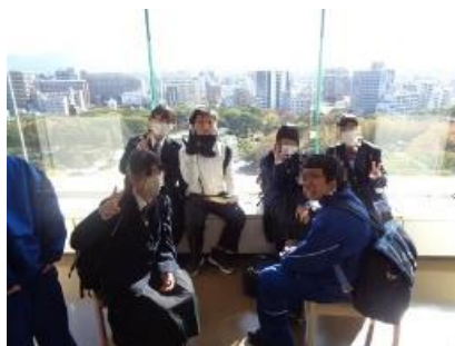
11階の展望室でくつろいでいます！