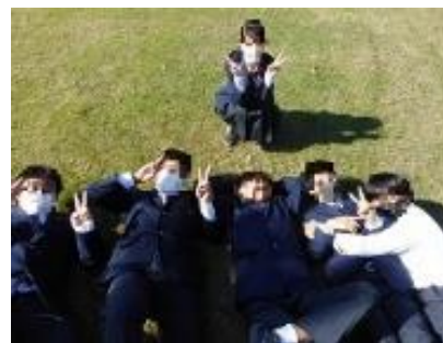
帰り際に芝生でゴロリ！