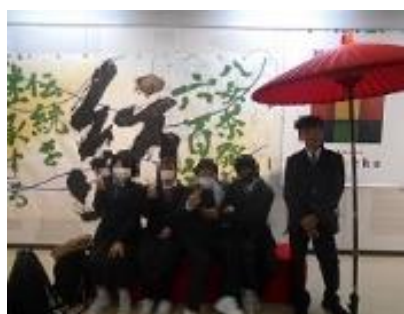
11階物産観光展示室を見学しました！