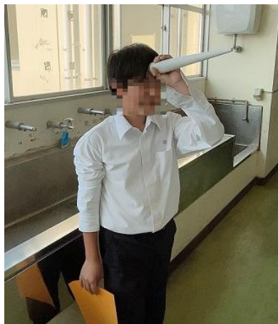
彼は「ユニコーン」だそうです（汗）