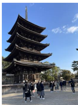
興福寺の五重塔 塔の高さは 50.1m！