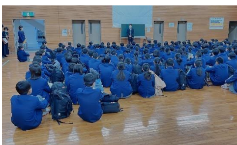
出発式 実行委員が進行しました

☆修学旅行1日目の様子☆ 元気に活動しつつも、きちんとマナーを守って行動しています。