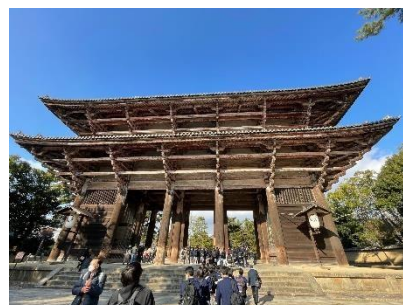
南大門 世界最大級の木造建築です