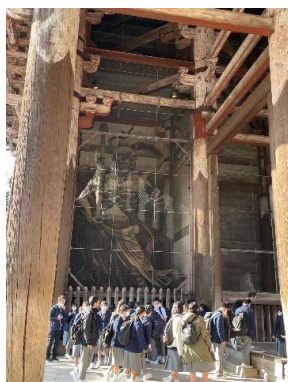
間近で見ると迫力のある金剛力士像