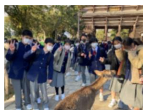
鹿に癒されています♪