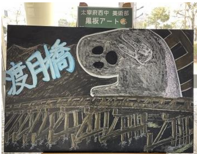
おまけの駄作です