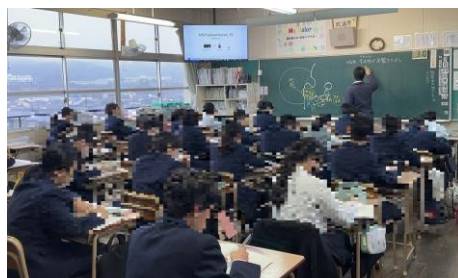
1年社会 室町幕府と東アジア 説明を聞き、考えていました！