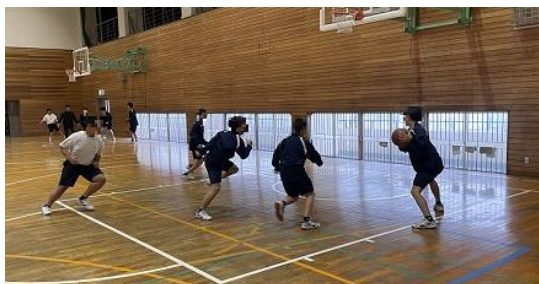
2年男子 保健体育 バスケットで攻守の攻防 考えながら動いていました！