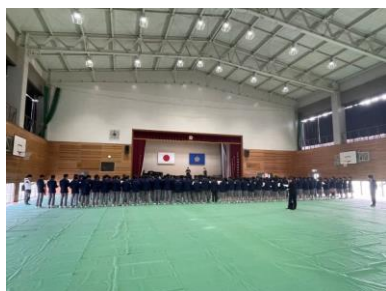
3年合唱練習 とてもきれいな歌声でした