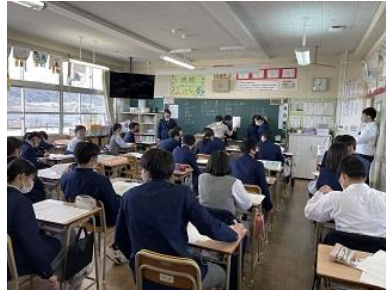
3年生文集づくり 担当係生徒が説明しています