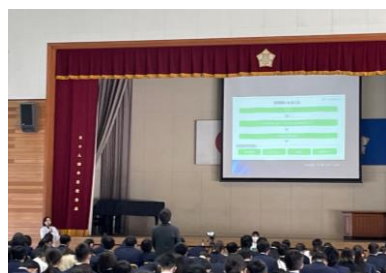
2年職業講話 薬剤師の方の講話でした