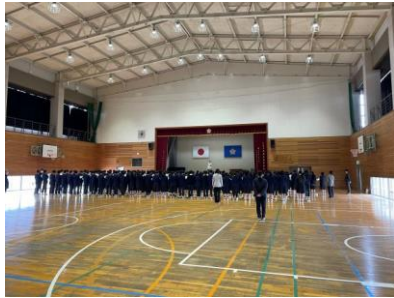
1年合唱練習 3年生を送る会に向けて 合唱練習をしました