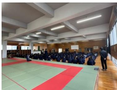
2年集会 朝学習の説明を聞きました