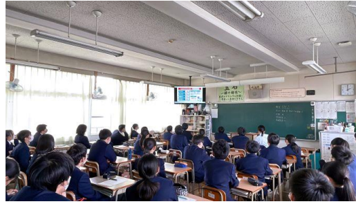
2年高校調べ 高校紹介ビデオを視聴しています