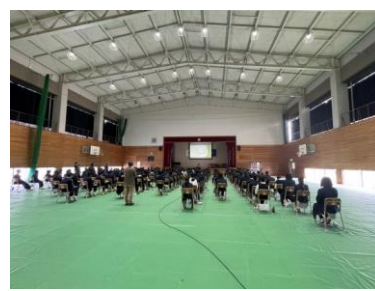
1年職業講話 消防士の方の講話でした