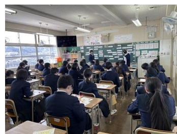
2年高校調べ 高校名を挙げています