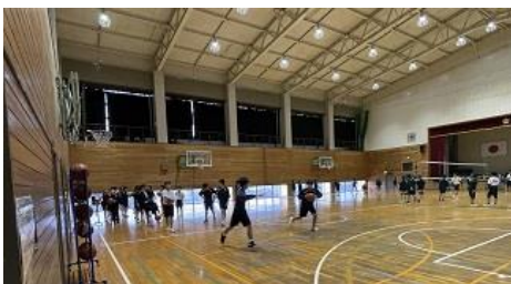
男女バスケットボール部