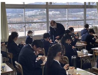
3組全員に名刺を配付