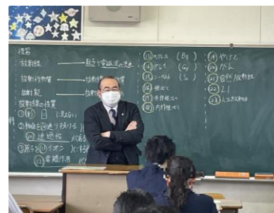
質問にお答えいただきました