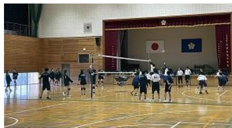
男女バレーボール部