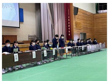
二人の議長の進行は見事でした