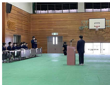
美化委員長の回答を聴いています