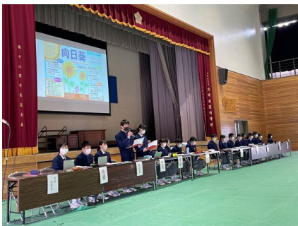
はじめにスローガン提案

結果的に1時間もかからずに生徒総会は終わりました。内容の濃い会でした。今日の審議をもとに、令和4年度も、生徒会活動が盛り上がり、たくさん太西 ★ が輝くことを期待します。そして、新しいスローガンにある、『 向日葵 ~咲きほこれ、満開の笑顔~』が達成され、皆が楽しく伸び伸びと太宰府西中学校で生活してくれることを期待します。