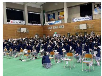
原案に対して決をとっています