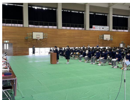
1年生も立派に意見を述べました