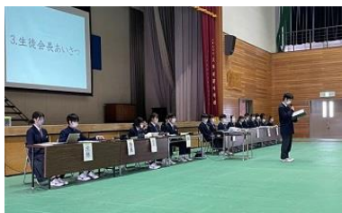
生徒会長がはじめに挨拶