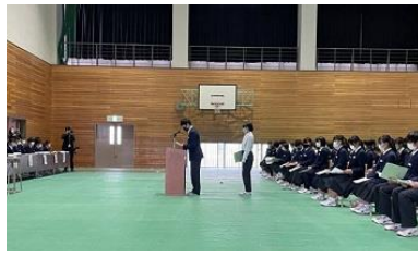
代表で質問をしている代議員と回答している委員長