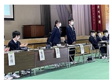
議長の進行はバッチリでした

令和5年度、第38期の 新たなスローガンは 『輝努愛楽』になりました！ 第38期の思いがたくさん つまった構想図が できました！