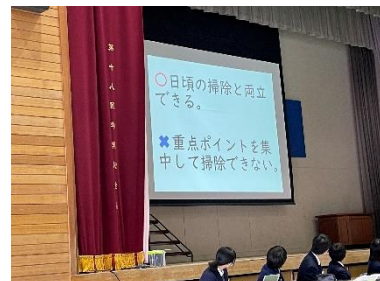
プレゼンはとてもわかりやすかったです