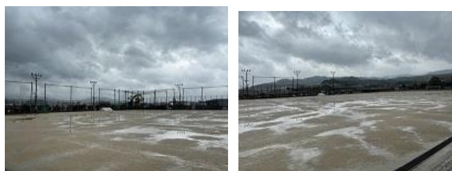
グラウンドは雨で水たまりができています