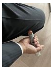
練習用エピペン (もちろん、針は出ません)