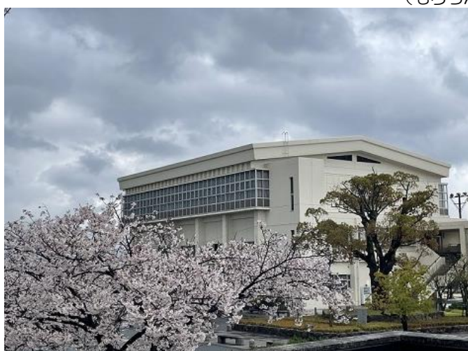
雨にも負けず、桜はきれいです