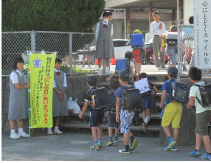
【にしの日：あいさつ運動】