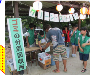
【夏まつり：運営参加】