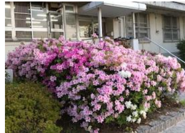
学校のつつじも満開

4月22日(金)の授業参観は1年生(193人)、2年生(133人)、3年生(152人)合計478人の保護者の皆さまに参加していただき、誠にありがとうございました。お子さんの様子はいかがでしたでしょうか。先生方の授業はどうでしたか。今年度もコロナ禍ではありますが、行事を工夫して実施していくつもりです。今後ともよろしくお願いいたします。