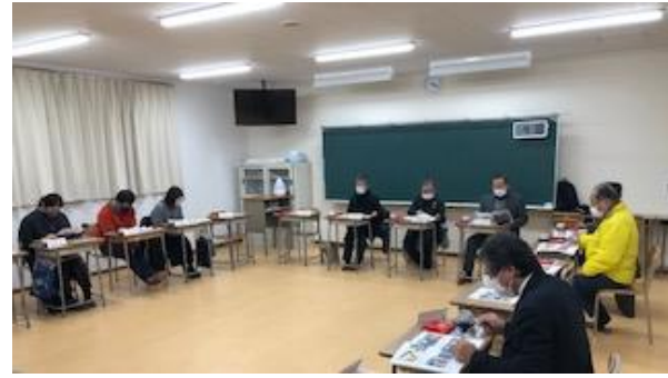
学校運営協議会の会議の様子

2月3日に本年度最後の学校運営協議会（コミュニティスクール：CS）を開催いたしました。このCSは本校の教育活動に対して積極的な意見や評価をいただいています。また、CS委員を二つに分けて、「地域連携部会」と「小中連携部会」で熟議を重ねてまいりました。第1回の会議を6月、2月に最終の第4回の会議を行いました。今回は会議において出された意見を掲載します。