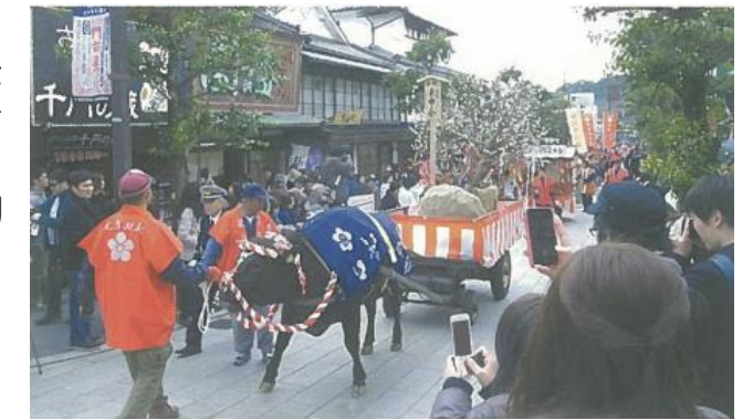
太宰府天満宮参道にて