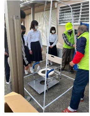
災害時の簡易トイレ