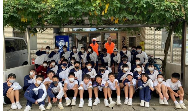
公民館前にて集合写真

自治会長をはじめ、各地区の役員の皆様、PTA 地区委員の方々、誠にありがとうございました。