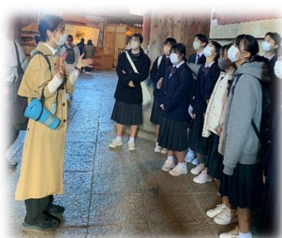
[奈良公園のガイドさん]